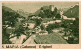
S. MARIA (Calanca) Grigioni

a 1950 10 c gn S. MARIA (Calanca) Grigioni 182 344