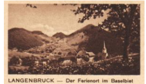
LANGENBRUCK — Der Ferienort im Baselbiet