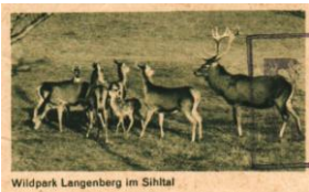
Wildpark Langenberg im Sihltal