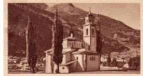
Sta. MARIA PR. POSCHIAVO