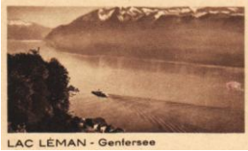
LAC LÉMAN - Genfersee