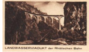
LANDWASSERVIADUKT der Rhätischen Bahn