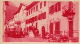
STA. MARIA im Münstertal (Graubünden)